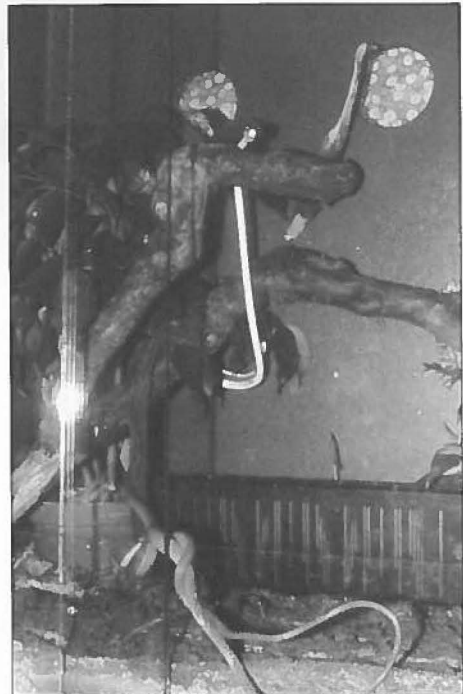
Fig. 3 Ahaetulla cf. prasina bij de paring in het terrarium. / 3 Ahaetulla cf. prasina while mating in the terrarium.

included in the collective name Ahaetulla prasina for the moment, waiting for a thorough review of this difficult species complex. The differences with other Ahaetulla prasina populations are not easy to quantify. My animals are smaller and more slender (fig. 5). The green basic colour is lighter. There are two light yellow ventrolateral stripes. The belly in between is white with three light blue stripes, two on the sides and one in the middle (fig. 4). The supralabials are yellow, the throat is white. This all fits however into the variation width of Ahaetulla prasina , as this species is defined at the moment.