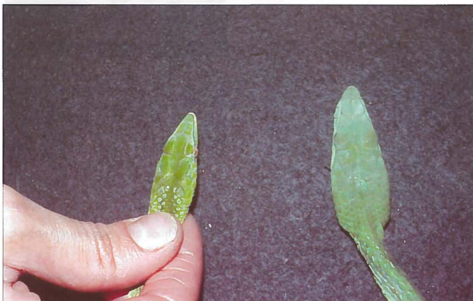
Fig. 5 Vergelijking van de kop van een typisch Ahaetulla prasina (left) exemplaar met die van Ahaetulla cf. prasina (right). / Comparison of the heads of a typical specimen of Ahaetulla prasina (left) and a specimen of Ahaetulla cf. prasina (right).

How does a treesnake come to feed itself with fish? I believe that it is not rare at all. When I wander through the nature of tropical forests, one thing strikes me over and over: of all potential food sources for snakes only fish abound. Lizards and mammals are significantly less abundant. In every brook however, even the smallest one, a manifold of small fish is present. Fishes sometimes make rather swift, abrupt movements. These movements could of course draw the attention of "visually oriented" lizard eaters. Therefore one doesn't need a lot of imagination to realize how treesnakes came to feeding on fish.