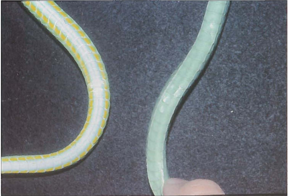
Fig. 4 Vergelijking van de buikkleuring van een typisch Ahaetulla prasina exemplaar (left) met die van Ahaetulla cf. prasina (right). / Comparison of the belly coloration of a typical specimen of Ahaetulla prasina (left) and a specimen of Ahaetulla cf. prasina (right).

boomslangen ertoe komen zich met vis te voeden.