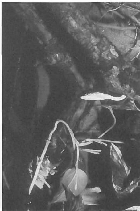
Fig. 1 Ahaetulla cf. prasina bij de jacht op vis. / Ahaetulla cf. prasina while hunting fish.

Dus de vraag rijst: welke soorten van dit geslacht voeden zich, tenminste gedeeltelijk, met vis? Doen ze het misschien allemaal? Dat geloof ik niet. Van Ahaetulla fronticineta is bekend, dat deze soort een levenswijze heeft die sterk watergebonden is. Stolicza (1870) bericht zelfs, dat deze soort steeds in het water vlucht en omschrijft haar als een slang van brak water. Deze soort werd meermalen zwemmend en duikend gezien, een zeer ongewoon gedrag voor een boomslang. Klaarblijkelijk leeft deze slang slechts in rivierdelta's en mangrove-