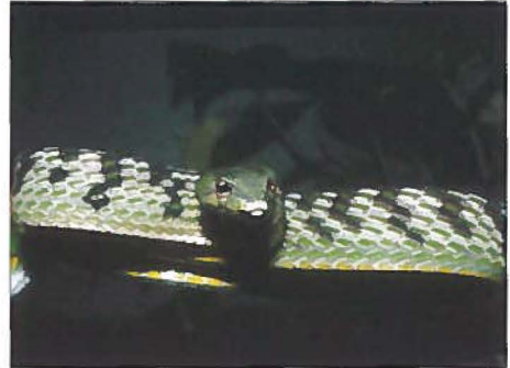
Fig. 6 en 7 Ahaetulla cf. prasina , vrouwtje. / Ahaetulla cf. prasina , female